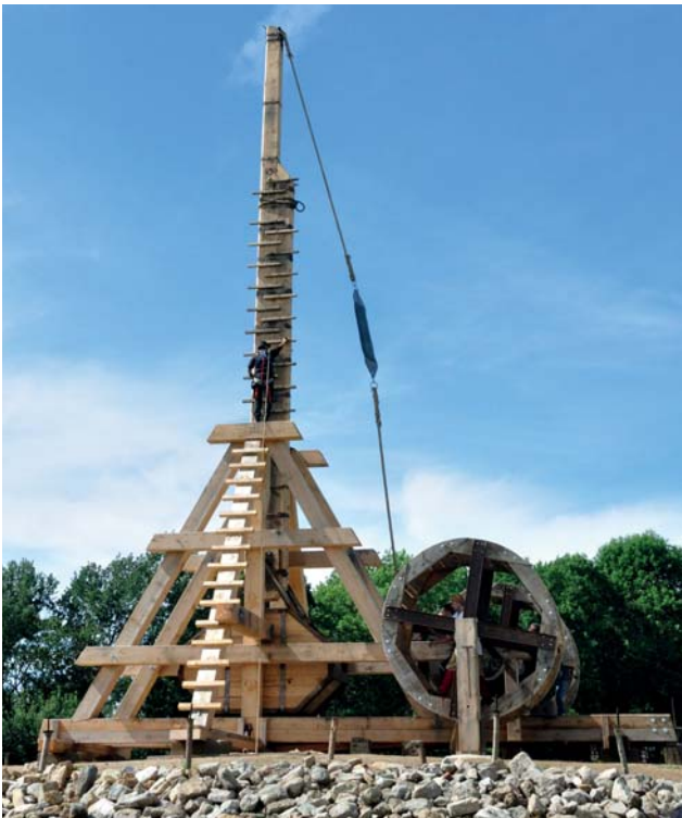
Trebuchet „Katharina die Zweite“