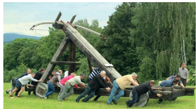
Zusammen anpacken beim Besuch des DRONCO-Teams 2016.