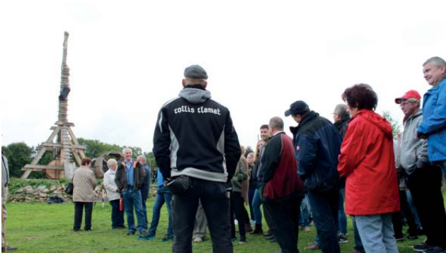
Teilnehmer der Freiwilligen Feuerwehr Lauf (Alter: 10 – 77 Jahre) im September 2017 bei der Trebuchet-Erklärung.

Das Geheimnis brennender Steine wird gelüftet! (Ja, wir lassen Steine brennen...)