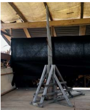
„Die Grazile Gretl“

Funktionstüchtiges Mini-Modell eines Trebuchets